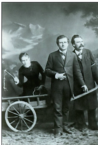
Friedrich Nietzsche, Paul Ree und Lou von Salome

Gefördert durch/ финансовая поддержка: Bayerische Staatskanzlei und Kulturreferat der Landeshauptstadt München