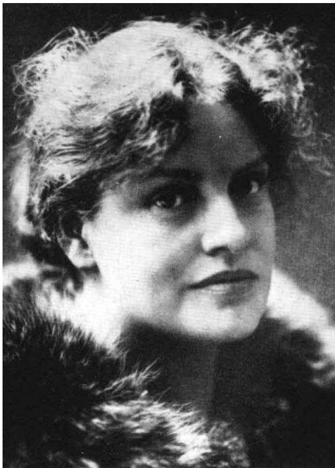
Lou Andreas Salome