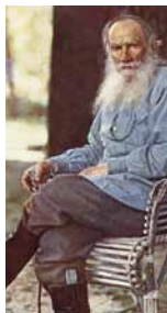
Fragment

«Любить – значит жить жизнью того, кого любишь»