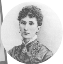
Peter Tschaikowskij und Nadeschda von Meck