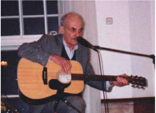
Bulat Okudschawa bei MIR e.V. (1994)