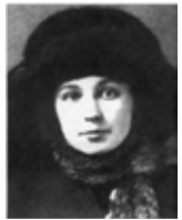
Foto: Marina Zwetajewa, 1917

Eine Liebeserklärung an Deutschland machte Marina Zwetajewa, eine der größten Dichterinnen des 20. Jahrhunderts, während des russischen Bürgerkrieges, als sie in Moskau 1919 in ihr Tagebuch schrieb: „Meine Leidenschaft, meine Heimat, Wiege meiner Seele! ... In mir sind viele Seelen. Doch meine Hauptseele ist deutsch“. Zwetajewa, deren Vater Iwan Zwetajew das Moskauer Museum für westeuropäische Kunst gründete und deren Mutter eine Pianistin polnisch-deutscher Herkunft war, fühlte sich der westeuropäischen Hochkultur sehr verbunden. Als Gymnasiastin hatte sie Frankreich, Deutschland und die Schweiz bereist, später übersetzte sie Lyrik aus mehreren europäischen Sprachen. Von 1922 bis 1939 verbrachte sie 17 Jahre in der Emigration: Berlin, Prag, Paris. Als sie 1939 in die UdSSR zurückkehrte, begann der Zweite Weltkrieg. Am 31. August 1941, zwei Monate nach dem Überfall Nazi-Deutschlands auf die Sowjetunion, nahm sie sich das Leben.