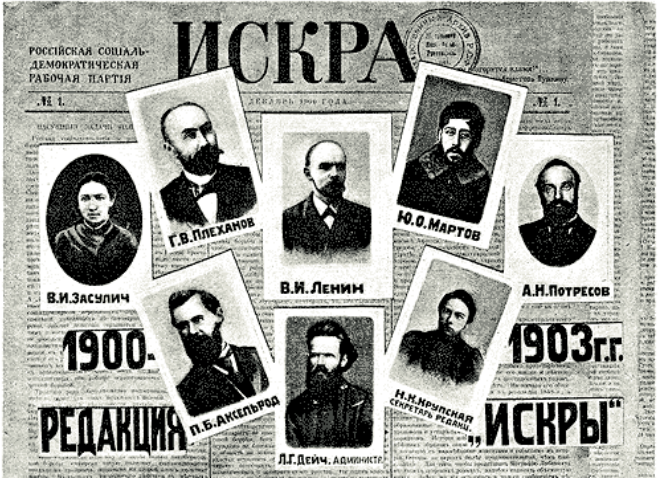
Redaktion der Zeitung „Iskra“

In München wird aus Wladimir Uljanow – Lenin. In Schwabing, wo er illegal unter dem Decknamen Dr. Mayer lebte, plante er die Russische Revolution. Während seines zweijährigen Aufenthalts (1900-1902) verlegte er in einer Münchner Druckerei die Untergrundzeitung „Iskra“ (Funke), in der sein berühmtes Werk „Was tun?“ veröffentlicht wird.