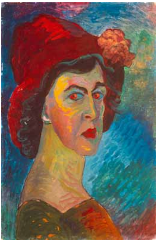
Selbstbildnis 1910, Lenbachgalerie, München

Gefördert vom Kulturreferat und dem Bezirksausschuss Maxvorstadt der Landeshauptstadt München