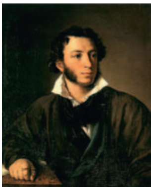
A.S. Puschkin, Maler: W. Tropinin