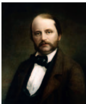
I.A. Gontscharow Maler N. Maikow

Литературный фестиваль, посвящённый 200-летию со дня рождения писателя Ивана Александровича Гончарова (1812-1891), с демонстрацией кинофильмов, снятых по мотивам произведений И.А. Гончарова.