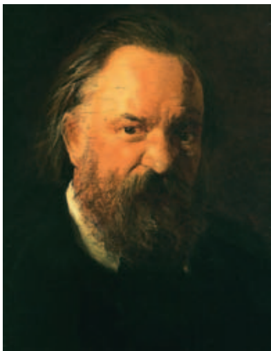
A.I. Herzen, Maler N. Ge

Zum 200. Geburtstag von Alexander Herzen (1812-1870) veranstaltet MIR einen literarisch-musikalischen Abend, der in das spannende Leben dieses russischen Schriftstellers,